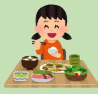
十分な休養と バランスの取れた栄養摂取

対応： 発熱や何らかの症状が出現したら、すぐに受診し以下の行動をとるようにしてください。