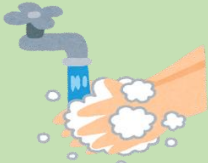
手洗い・手指消毒