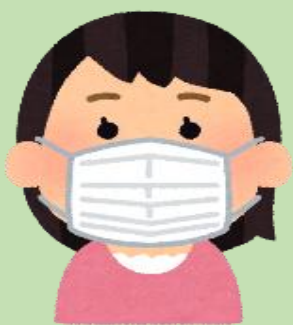
正しいマスクの着用